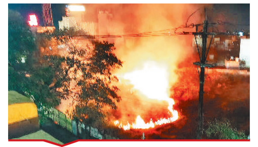
बुधवार की रात उसलापुर ओवरब्रिज के नीचे आग लग गई। जिसके कारण ओवरब्रिज पर ट्रैफिक जाम हो गया।

[बिल्हा | मस्तूरी | तखतपुर | मुंगेली | कोटा | लोरमी | सरगांव | पेंड़ा | बेलतरा | रतनपुर | पथरिया]