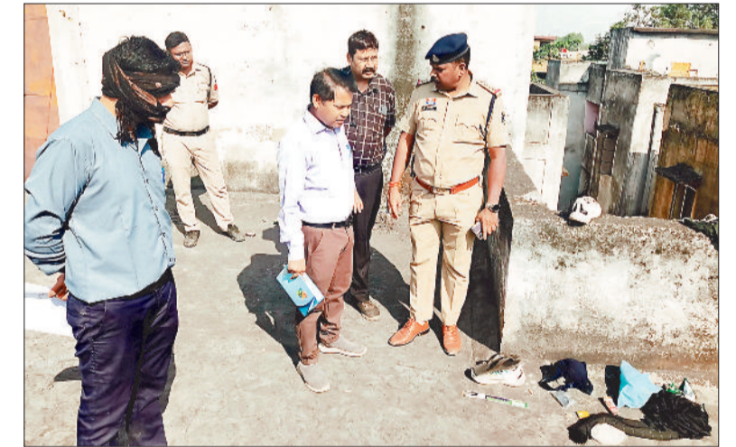
घटनास्थल का निरीक्षण करते पुलिस अधिकारी।