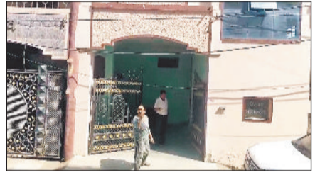
हरिभूमि न्यूज ►► बिलासपुर

एक बार फिर चोरों ने सक्रियता दिखाते हुए रिटायर्ड बैंककर्मी के सने मकान के दरवाजे का कुंदा तोड़कर आलमारी के लॉकर से 11 तोला सोना, चांदी के जेवर व नकद रकम चोरी कर आसानी से भाग गए।