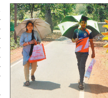
लगातार बढ़ रहा अधिकतम तापमान

तापमान में गिरावट आने की फिलहाल कोई संभावना नहीं है। मौसम विभाग ने तापमान में अभी लगातार बढ़ोतरी होने एवं 24 अप्रैल से लू चलने की संभावना जाहिर की है। यह स्थिति 26 अप्रैल तक बनी रहेगी। भीषण गर्मी का यह आलम है कि शहर में सुबह 11 बजते ही लोग सड़कों पर निकलने से परहेज करने लगे हैं। शहर में प्रचंड गर्मी का सिलसिला जारी है, लेकिन इसमें आगे भी अभी राहत के आसार नहीं हैं। सुबह आठ बजे से ही धूप चुभ रही है और ग्यारह बजते-बजते तो