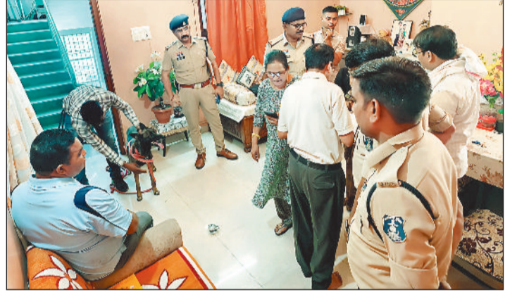
गीतांजलि विहार स्थित मकान में जांच करती पुलिस।