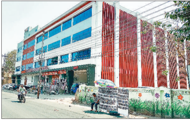
सिटी कोतवाली परिसर स्थित मल्टीलेवल पार्किंग में बनी दुकानों को किराए पर लेने कोई तैयार नहीं है।

कोतवाली में 46 में 22 दुकानें तो इमलीपारा में 59 में से 29 दुकानें अभी भी खाली हैं