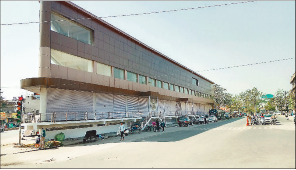
इमलीपारा पुराना बस स्टैंड के पास बनाई गई दुकानें खाली पड़ी हैं।

35 करोड़ खर्च कर कोतवाली और इमलीपारा में दो व्यावसायिक कामप्लेक्स बनाए गए हैं। इसमें कोतवाली में 46 में 22 दुकानें तो इमलीपारा में 59 में से 29 दुकानें अभी भी खाली हैं। इन दुकानों के लिए निगम बार-बार टेंडर कर रहा है लेकिन कोई नहीं ले रहा है। व्यापारियों का कहना है कि इन दुकानों का किराया इतना अधिक रखा गया है कि इसे लेने में परेशानी हो रही है। प्रीमियम जगह की दुकानें खाली रहने पर सवाल भी उठ रहे हैं।