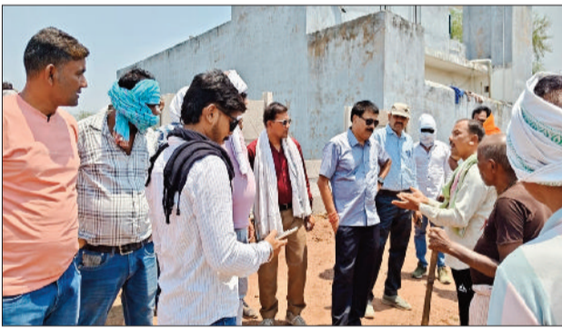
तिफरा सेक्टर डी में कार्रवाई करते निगम के अधिकारी।