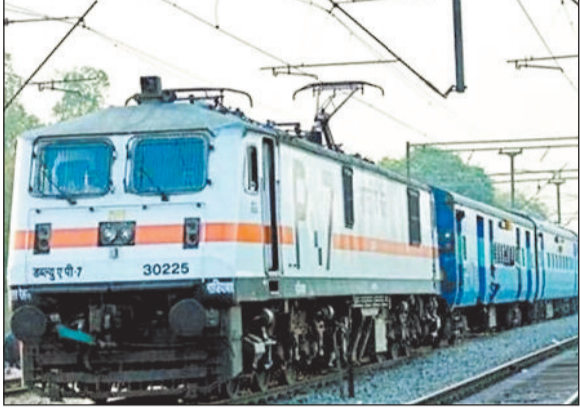
हरिभूमि न्यूज || बिलासपुर

गर्मी की छुट्टी शुरू होने के साथ ही ट्रेनों में भीड़ के कारण यात्रियों की परेशानी को देखते हुए रेल प्रशासन ने 88 ट्रिप के लिए 18 समर स्पेशल ट्रेनों का परिचालन शुरू किया है, जिसमें यात्रियों को कंफर्म बर्थ की सुविधा मिल सकेगी। दक्षिण पूर्व मध्य रेलवे ने यात्रियों की सुविधा हेतु विशेष प्रबंध किए गए हैं। क्षेत्र के प्रमुख एवं व्यस्त स्टेशनों जैसे बिलासपुर, रायपुर, दुर्ग, गोंदिया, इतवारी, रायगढ़ एवं शहडोल सहित अन्य महत्वपूर्ण स्टेशनों पर यात्री सुविधाओं को सुदृढ़ किया गया है। इनमें प्लेटफॉर्म प्रबंधन, अतिरिक्त टिकट काउंटर, पेयजल व्यवस्था, प्रतीक्षाशालाओं में सुधार, स्वच्छता व्यवस्था एवं सुरक्षा व्यवस्था को और अधिक मजबूत किया गया है, ताकि यात्रियों को किसी प्रकार की असुविधा का सामना न करना पड़े। यह व्यवस्था विशेष रूप से उन लाखों यात्रियों के लिए लाभकारी सिद्ध होगी, जो गर्मी के मौसम में अपने गंतव्य तक यात्रा करते हैं।